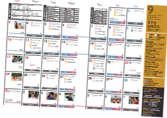
▲毎月のお役立ちカレンダーで開庁日を確認できます。

● マイナポイントの申請をお忘れなく マイナポイントの申請は9月末までです。期限を過ぎると受け取りできませんので、ご注意ください。 マイナンバーカードを令和5年2月末までに申請した人で、次の表に該当する人に最大2万円分のポイントが付与されます。