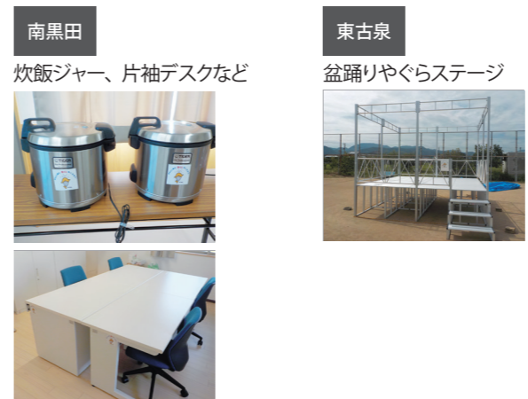
町民課コミュニティ係 ☎985-4228

自治総合センターの宝くじ受託事業収入を財源としたコミュニティ助成事業で、南黒田地区と東古泉地区に次のコミュニティ備品が整備されました。