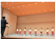
8月11日、愛媛県少年少女合唱連盟演奏会に出場

練習の見学や体験も大歓迎。申し込み方法など、詳細は町ホームページ(右のQRコード)を確認を。 社会教育課生涯学習係 ☎985-4135