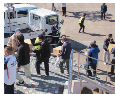
⑤物資受け入れ訓練 ⑥避難者の体調を確認