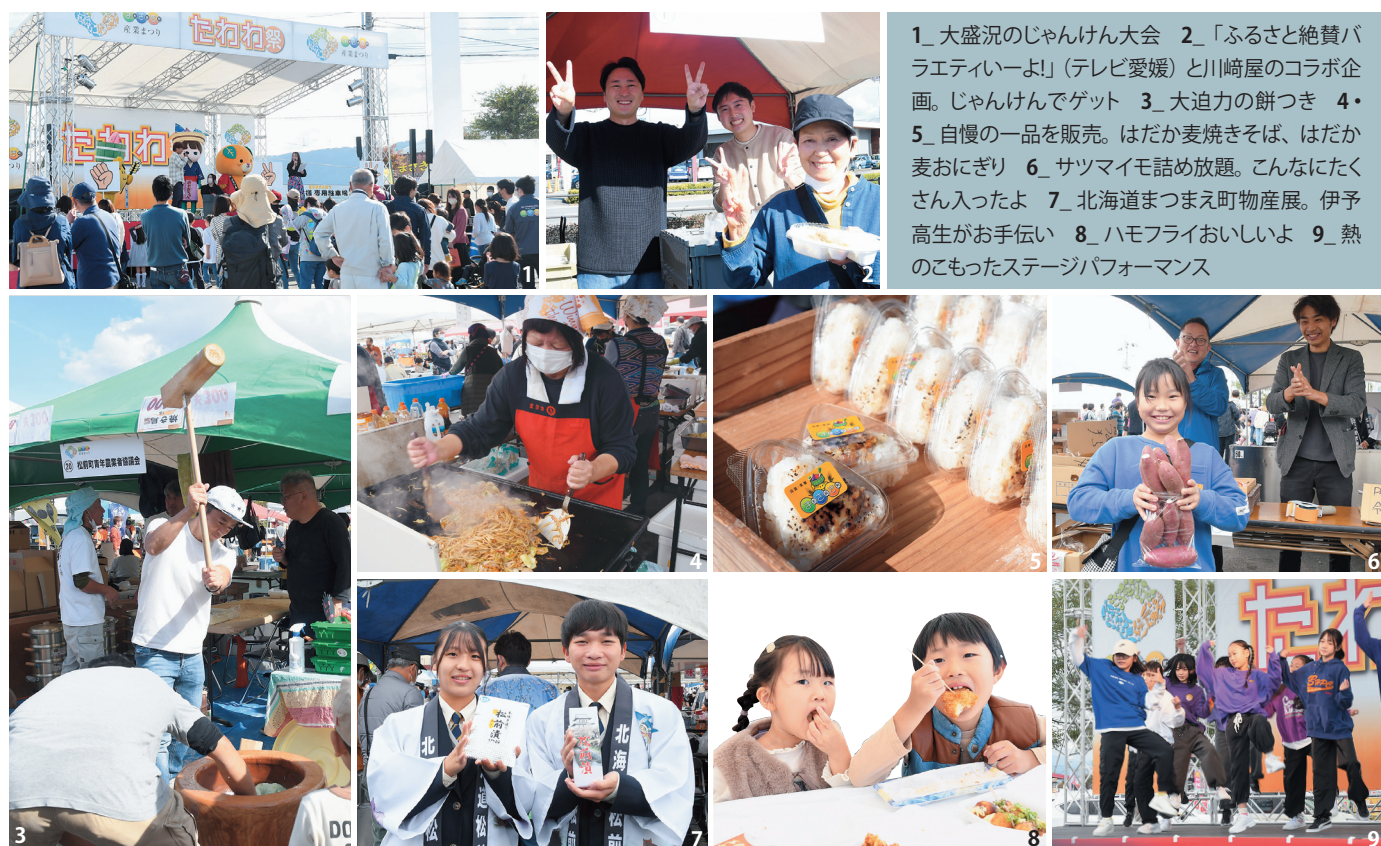
1_大盛況のじゃんけん大会 2_「ふるさと絶賛バラエティーよ!」(テレビ愛媛)と川崎屋のコラボ企画。じゃんけんでゲット 3_大迫力の餅つき 4・5_自慢の一品を販売。はだか麦焼きそば、はだか麦おにぎり 6_サツマイモ詰め放題。こんなにたくさん入ったよ 7_北海道まつまえ町物産展。伊予高生がお手伝い 8_ハモフライおいしいよ 9_熱のこもったステージパフォーマンス