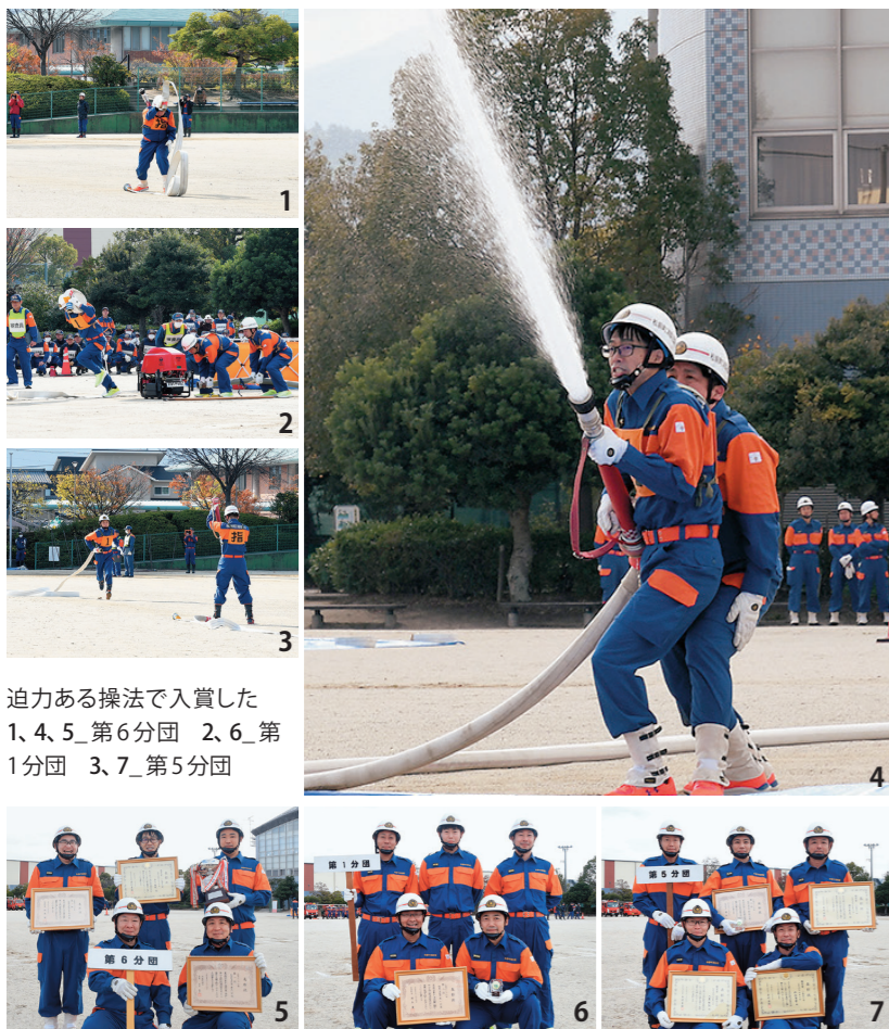
迫力ある操法で入賞した 1、4、5_第6分団 2、6_第1分団 3、7_第5分団