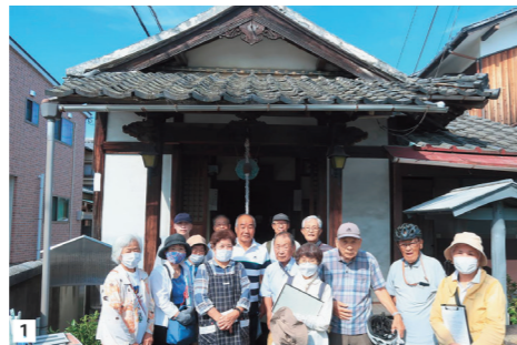
1 延命地蔵尊 松山城主がこの地へ勧請した理由は明らかでないが、享保の大飢饉の犠牲者を弔い、領民の息災を祈願したものと考えられる

延命地蔵の境内には短歌二首が刻まれた歌碑があり、信仰のあつい信者のいることが分かる。次号に続く(武智修一記)