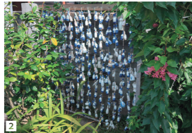
2 祈願成就お礼の御神酒徳利 祈願成就のお礼が御神酒徳利になった由来は定かでないが、徳利の水でいぼが取れるという地蔵信仰があり祈願成就のお礼が徳利になったという伝説がある