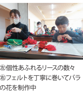
⑤個性あふれるリースの数々 ⑥フェルトを丁寧に巻いてバラの花を制作中

11月11日、「おもしろミニ工房」を開催し、岡田小学校の児童とその保護者など26人が参加しました。