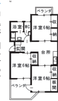
改良住宅 6-2号 筒井 1253 (1階)