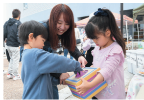
①おまけのくじ引き ②物作り体験ワークショップ