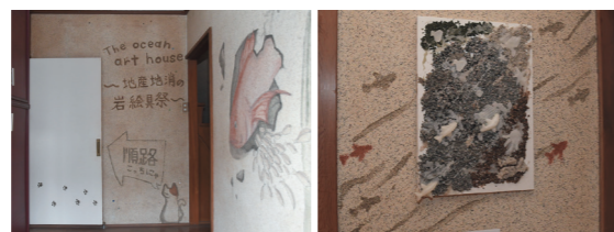
①石を削って作った絵具で塗り絵を体験 ②入り口では大きな鯛がお出迎え。深海ツアーの始まり ③粉碎した石と溶かしたろうそくで作った作品