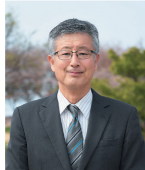
あだち かずし 足立 一志 教育長

4月1日、徳居芳之副町長と足立一志教育長が就任しました。任期は、徳居副町長が令和10年3月31日まで、足立教育長が令和9年3月31日までです。