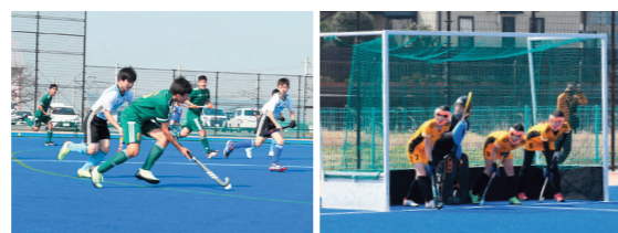
④低い体勢からゴールを狙う ⑤スピードに乗ったドリブル ⑥ゴールは必ず守る