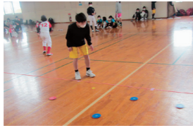
①よ〜く狙って ②卒団証書を授与される6年生