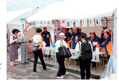
ドリンクサービスの様子

大会期間中、運営を支えてくれるボランティア「愛顔つなぐマッキー応援隊」を募集します。 ▶活動日 上記のリハーサル大会期間中 ▶活動場所・募集締切 売店出店者募集に記載した内容と同じです。 ※1日単位とし、複数日の参加もできます。 ▶活動内容 受け付け・案内、会場サービス、環境美化など ▶対象 町内在住・在勤・在学の中学生以上の個人または団体 ※ リハーサル大会以外にも、来年のえひめ国体などでのボランティアも募集しています。