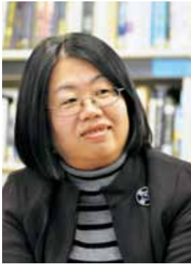
(財)愛媛県国際交流協会 外国人生活相談室長