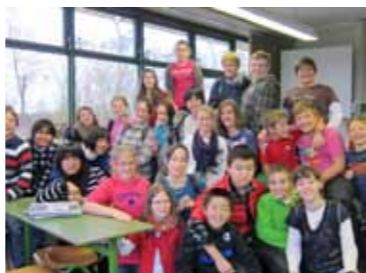
昨年11月の第18回海外派遣。ライヒスシュタット高校で