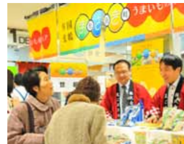
のれんの「まさき」に大勢の人が視線を向け、町に興味を示していました