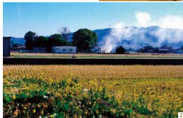
3月のふるさと歴史散歩は、休みます。