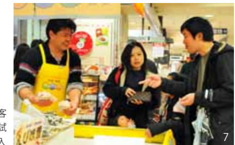
6. 「はいどうぞ」かわいいお客さんに試食をすすめる 7. 試食をした人の多くが商品を購入