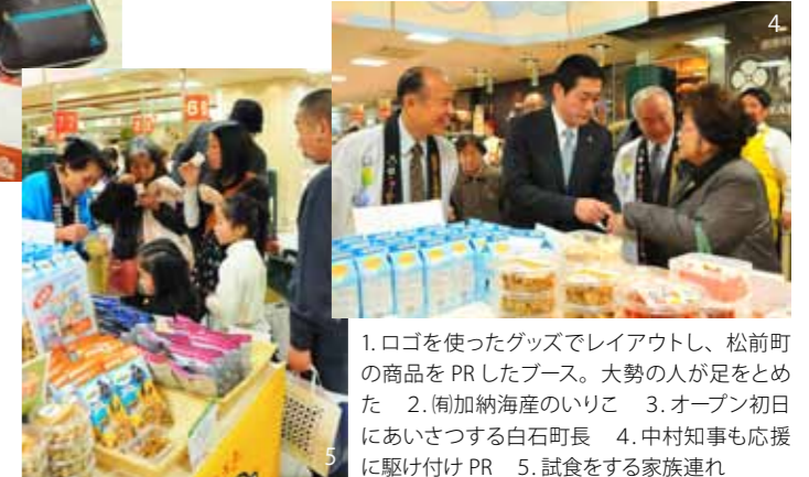
1. ロゴを使ったグッズでレイアウトし、松前町の商品を PR したブース。大勢の人が足をとめた 2. (有)加納海産のいりこ 3. オープン初日にあいさつする白石町長 4. 中村知事も応援に駆け付け PR 5. 試食をする家族連れ