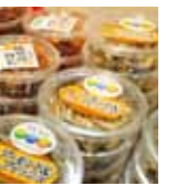
ロゴシールを貼った商品

県町連携で行った取り組みということで、中村時広知事も応援に駆け付け 都会では、その土地の特色があるものが受け入れられます。それはふるさとへの愛着につながります。今回の取り組みを機にどんどん売り出し、道を開いてほしい」とエールを送りました。白石勝也町長は「松前町は全国では知名度がありません。第 1 の目的は町を PR すること。私自身フェアを 2 日間見て、効果があったと感じています。これで終わらせないで、いろんな地域へ松前を売り出していきたい」と話していました。