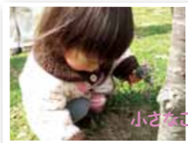
小さな子どものための自然観察会

足に気になる症状はありませんか？ フットケアで足を守ろう 第3回血管いきいき☆糖尿病予防のつどい 足先がピリピリ痛む、足の裏に何か張り付いたような感じがある、足がしびれるなどの症状は、糖尿病の合併症(末梢動脈疾患・糖尿病神経障害)でみられる症状です。フットケアで足を守りましょう。 2階 集会室 ▼対象 松前町在住で糖尿病予防に関心のある人 ▼参加費 無料 ▼定員 50人 ▼申し込み方法 電話で申し込んでください。 ▼締め切り 3月8日(木) ▼申込先 健康課保健センター係 ☎985-4118