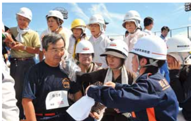
①応急救護訓練の様子