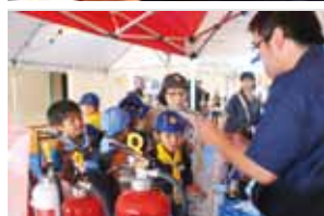
②消火器の説明を受ける子どもたち