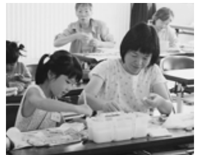
▲お母さんもいっしょけんめい!

1日目は、受講生各自が準備(拾ってきた)石ころが何に見えるか、また感じられるかを先生の作品を見ながら学びました。そして、さっそく下絵描きに挑戦しました。普段何気なく見過ごしている石ころですが、よくよく見るとかえるに見えたり、いろいろな動植物に見えるものです。次に、その石ころに色をつ