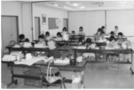
▲石のアートコース 教室風景

本年度、岡田校区青少年育成会では新たな試みとして、「我ら未来のアーティスト」と題して「切り絵コース」と「石のアートコース」の2つのコースを、夏休みを利用して開催しました。