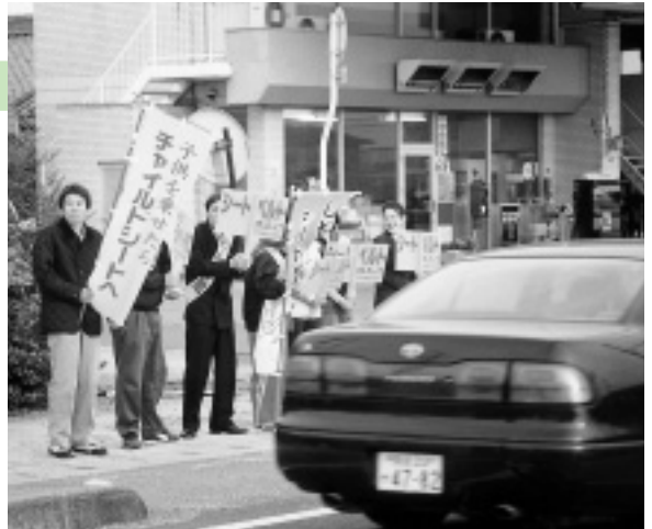
▲交通安全を呼びかける中川原愛護班の皆さん