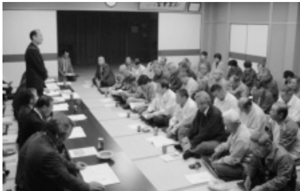
▲恵久美での懇談会の様子