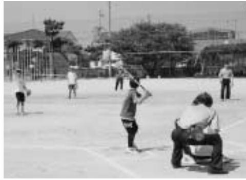
▲未来のホームラン王