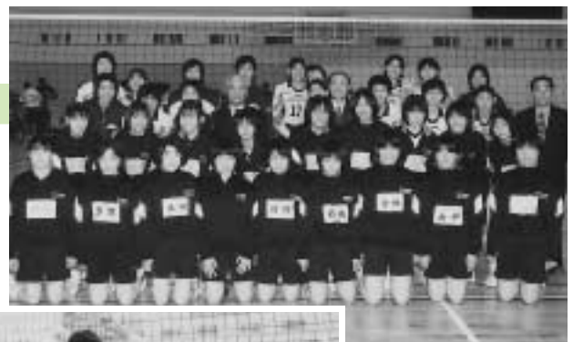
▲北伊予中学校の皆さん