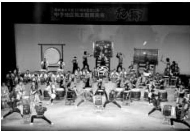
▲腹に響くぜ、太鼓の音色!

今後は、この提言の趣旨を十分に踏まえ、今年の9月定例議会には条例（案）を上程し、平成13年度中の施行を目指して準備を進めていきます。