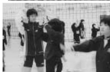
◀熊前知加子選手から指導を受ける生徒たち