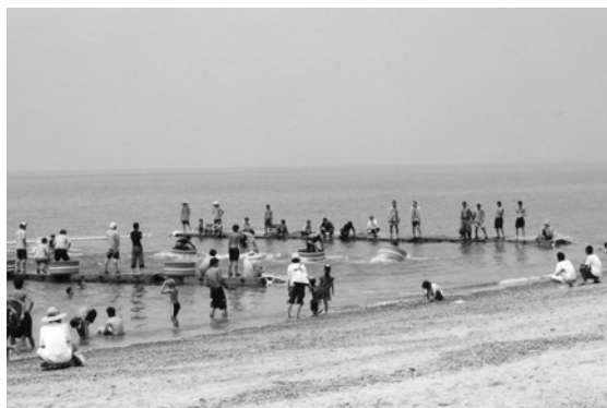
はんぎり競漕(夏まつり)でにぎわう塩屋海岸

町長 町内にたくさんある俳句の 碑や、福德泉公園、有明公園など を載せたパンフレットをエミフル に置かせてもらっています。また、 塩屋の海岸、重信川河口といった 自然や、松前の特産品なども入れ たガイドブックを新たに作つて、 エミフルに来た人が、町内にある きれいな場所や美味しいものも楽