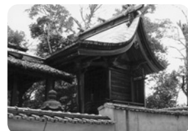
▲神殿…深い森と霊泉に囲まれていた。千木・堅魚木・長く美しい反りのある庇に威厳を感じる