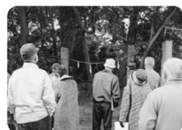
▲神殿裏の入らずの森…後方に五輪の塔が見える。呪いの「丑の刻参り」の話も…