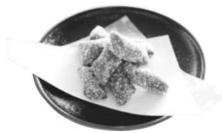
● 黒ごまきな粉げんこつ飴