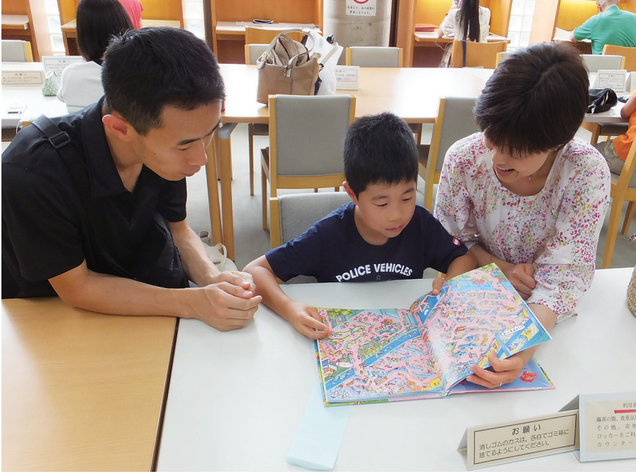
本が好きな子に育てたい