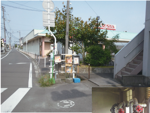
歩道整備が急がれる水路