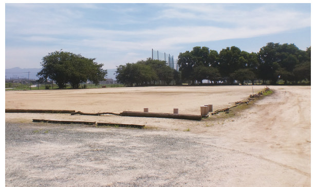
3年後が楽しみだ。ホッケー場予定地（鶴吉）

答 派遣職員の健康維持や精神的負担の軽減を図るため、松前町への帰省回数を年3回から12回に増やすもの。費用は全額、派遣先が負担する。