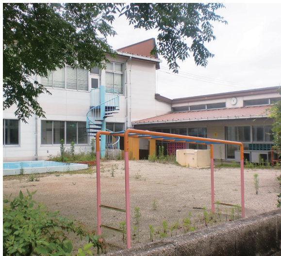
解体予定の若葉保育所