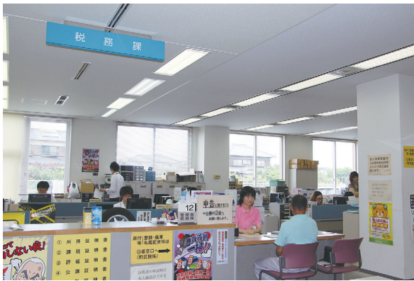
また値上げ、税務相談も増えるかな？

本会議で「ウイルス性肝炎患者に対する医療費助成の拡充を求める意見書」の提出を全員一致で可決した。 【内容】 1 ウイルス性肝硬変・肝がんに係る医療費助成制度を創設すること 2 身体障害者福祉法上の肝機能障害による身体障害者手帳の認定基準を緩和し、患者の実態に応じた認定制度にすること 従来のネット配信による議場のライブ中継に加え、6月議会より録画配信ができるようになりました。議会終了概ね1週間後から町ホームページで視聴できます。ますます、議会の情報を皆さんにお届けできる機会が増えます。