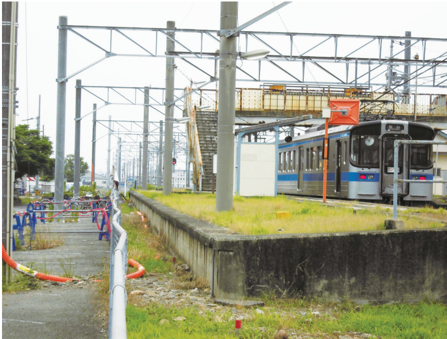
工事中の3番線路と北伊予駅高架橋