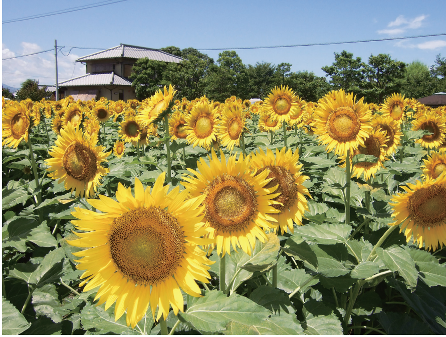
松前町の町花「ひまわり」資源としてどう活かすか