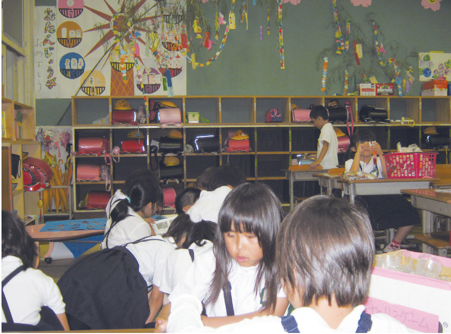
お母さんが安心して預けられるように