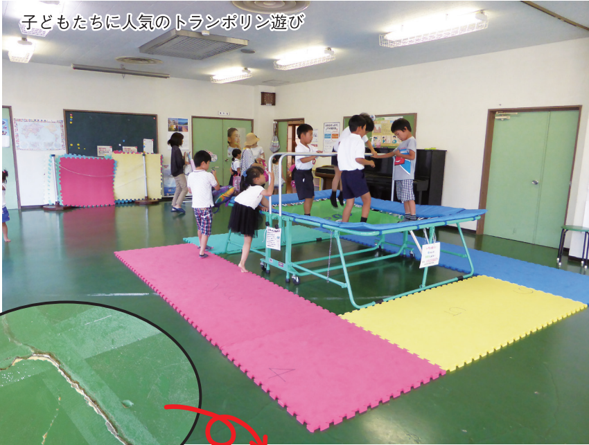
早く直して床のひび割れ