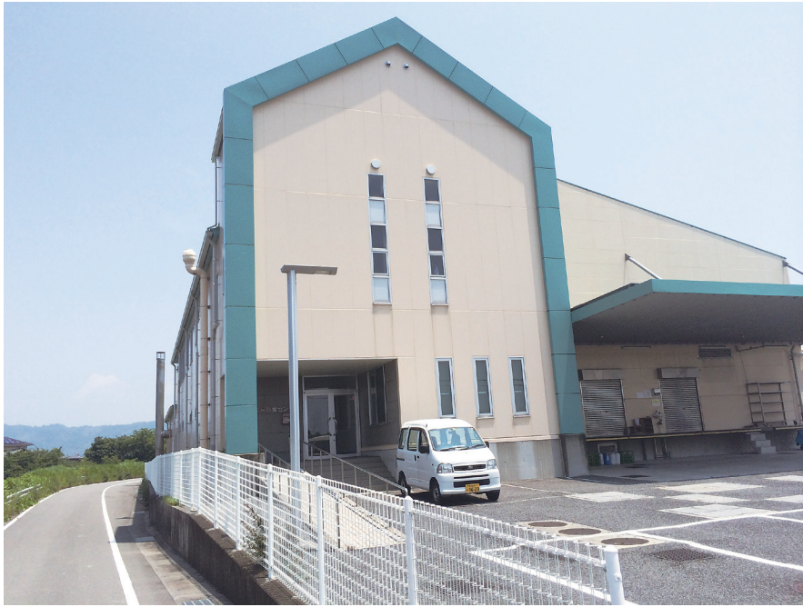
調理業務の民営化が検討されている学校給食センター