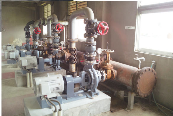
施設への送水管は早急に耐震化を図る