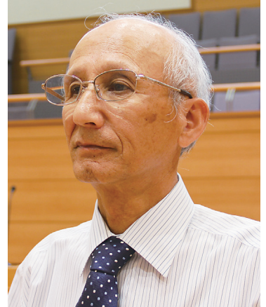
稲田 孔 議員