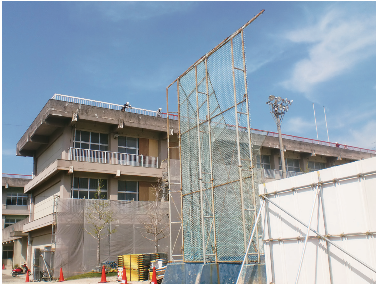
安全・安心な校舎で勉強がんばれ！