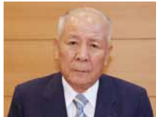
木下 淳 議員