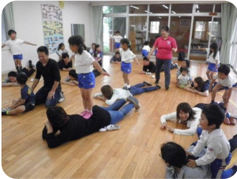
ぶら下がったり抱きついたり、親子で触れ合うとみんな自然と笑顔になりました。