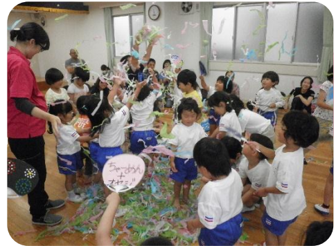
紙をちぎり、うちわであおぐと紙ふぶきが舞い上がり、この日一番盛り上がりました。