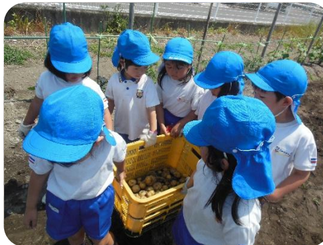
みてみて、いっぱい採れたよ。