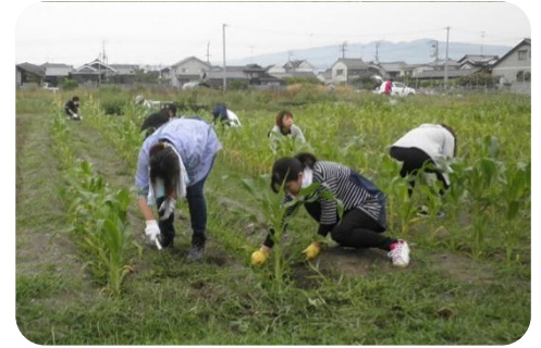
まさきっこ農園もお母さんたちが草を抜いてくれました。