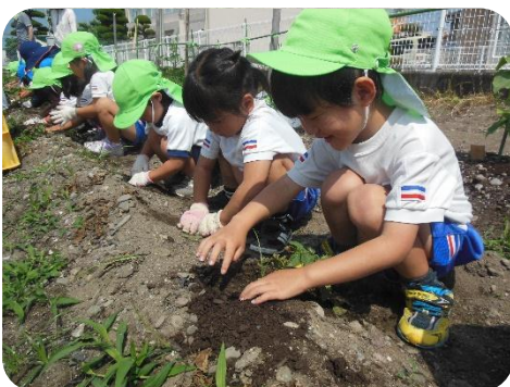
ジャガイモ、どこに隠れているかな。

今年1月に植えたジャガイモが大きくなり、みんなで収穫をしました。「どこにジャガイモがあるん?」「ここにあったよ」と言いながら夢中で土を掘ると、ジャガイモが出てきました。その後、収穫したてのジャガイモを蒸していただきました。「おいしい」「おかわり」と採れたての美味しさを味わいました。