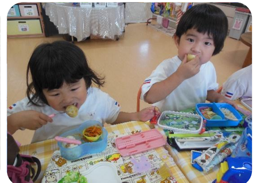
採れたて美味しいね。