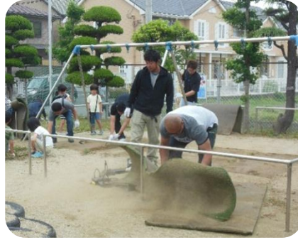
お父さんたちが大活躍してくれました。