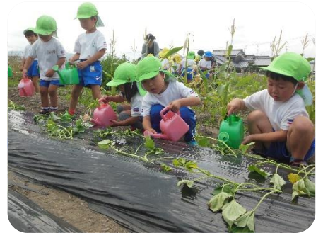
お水をたっぷりあげました。