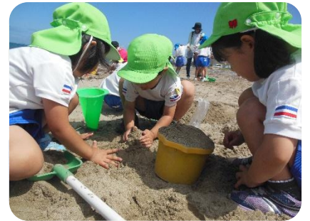
美味しい手作りケーキできるかな。