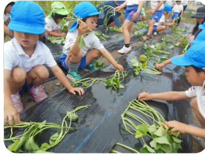
大きく甘く育てね。