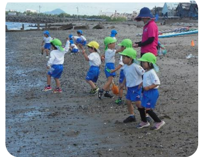
波が行ったり来たりしておもしろいね。

6月14日(金)に第1回「おいでおいでまさきっこ」を行いました。小さな友達がうちの方と一緒に幼稚園に遊びに来てくれました。水遊びやサーキット遊びなど、園児たちに交じっているいろいろな遊びを体験しながら元気いっぱいに過ごしました。