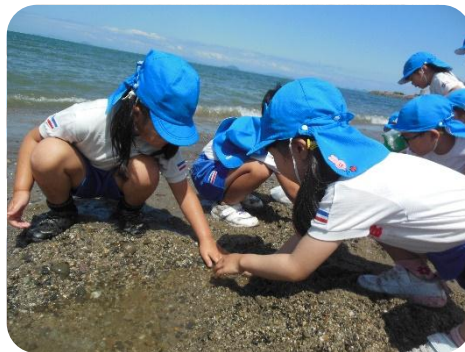
掘っても掘っても水が出てくるよ。なんでかな？