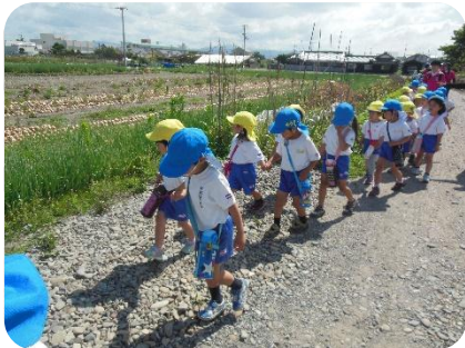
畑にいろんな夏野菜が育っているね。

3歳児は、初めての園外保育でした。5歳児と手をついで西の浜まで歩いていきました。行く途中にスイカやキュウリなどの夏野菜も見ることができました。海では砂浜の感触や海の匂いなどを感じながら異年齢で一緒に遊びました。