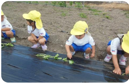
初めてのサツマイモ苗植え、穴に入れるのが難しかったね。

サツマイモの苗を植えました。植えた後は、「大きくなってね」「甘いサツマイモになってね」と水をあげました。みんなでお世話をして、収穫へ期待をふくらませていきたいです。