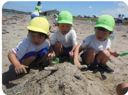
幼稚園の砂場の砂と違ってサラサラするね。