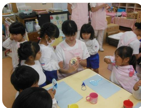
どうやってハミガキをしているか、年少組も興味深そうに見ています。