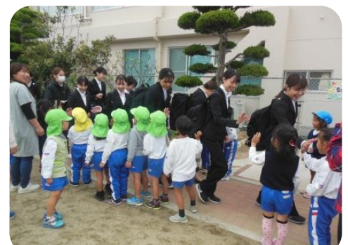
ありがとうございました。みんなでお見送りをしました。