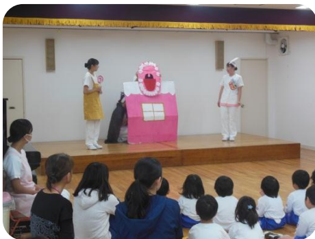
学生さんが劇を観せてくれました。

河原学園歯科衛生学科の学生さんによる「はみがき指導」がありました。遊戯室で劇を観たり一緒に体操をしたりしました。その後、年中・年長組は各保育室にて実際にハミガキ指導をしてもらいました。学生のお姉さんに「上手にできたね」と声をかけてもらおうと笑顔を見せていました。