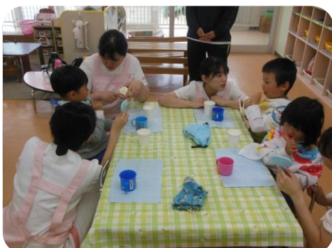
鏡を見ながら、ハミガキの仕方を教えてくれました。