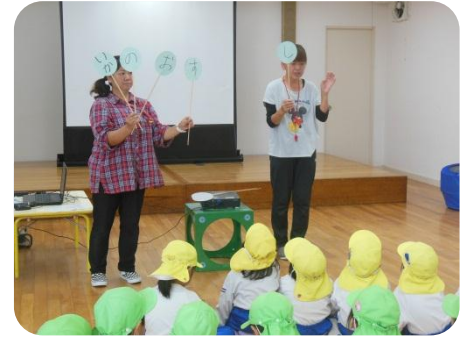
「いかのおすし」の合言葉、忘れないでね。