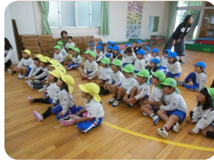
初めての訓練、どうやって避難をするのかな。