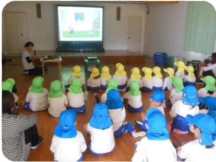
不審者が来た時の避難の仕方のスライドを見ました。

不審者対応訓練をしました。最初に遊戯室に集まり避難の合図・仕方や「いかのおすし」の約束についてのスライドを見ました。その後、園庭に移動して訓練をしました。笛の合図や先生の指示を聞いて全員避難することができました。