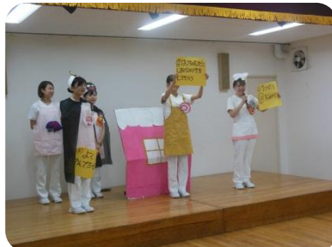
虫歯にならないために3つの約束を守ろうね。