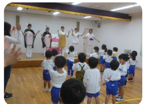
一緒にハミガキ体操をしました。