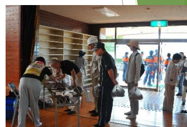
避難訓練の様子（松前町）