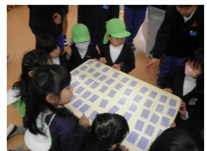
トランプ遊びでは小学生が「分かる？」「このカードだったかな？」と優しく声をかけてくれ、一緒に楽しむことができました。