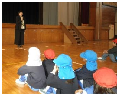
校長先生がお話をしてくれました。