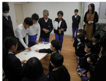
手品が成功するたび「えー！すごい」「なんで分かったん？」と驚きの声が聞かれていました。