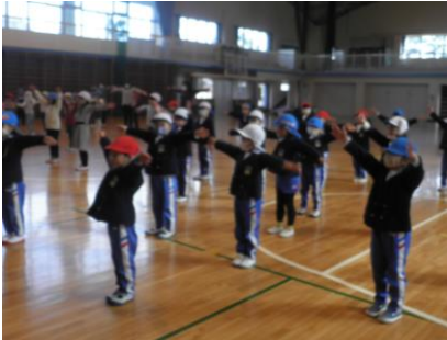
準備体操をしました。

松前幼稚園、黒田保育所、松前ひまわり保育所の5歳児が松前小学校の体育館で幼保交流会をしました。保育所の友達と体をくっつけてふれあい遊びをしたり赤・青・白のチーム対抗でゲームをしたりしながら、同じ校区の小学校へ就学することへの期待を一層膨らませていきました。