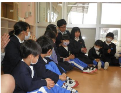
マジカルバナナでは、ヒントを言ってもらいながらすることができました。

11月に引き続き、松前小学校の5年3組と第2回目の交流を行いました。手品やペープサート、お笑いなど、たくさんの活動を計画してくれていました。最後にはお互いに質問コーナーがあり、小学校のことを教えてもらいました。