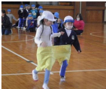
デカパン競争では、違う園の友達と息を合わせて走ったり、自分のチームを精いっぱい応援したりしました。