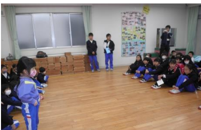
「好きな実験は何ですか？」「大変なことは何ですか？」と質問をして小学生を驚かせていました。