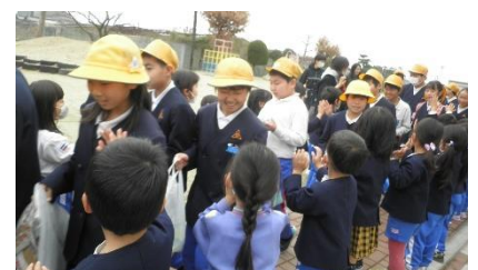
「来てくれてありがとう」の気持ちを伝えながらタッチで見送りました。