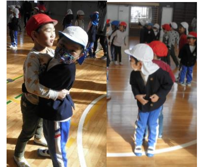
「ひっつきもっつき」の歌に合わせて友達と体の部位をくっつけてふれ合いました。