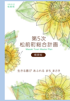
▲第5次松前町総合計画

町民の皆さんにとって、より住みやすい、快適なまちづくりのため、2年度の取り組みとお金の使い道を計画しました。本年度からスタートする第5次総合計画の5つの柱に沿って紹介します。