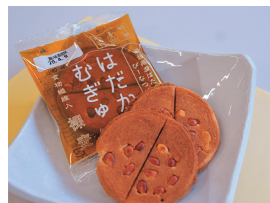
◀「はだかむぎゅ」新商品

この「はだかむぎゅ」は、現在中四国・九州の一部スーパーなどで発売中。今後は全国展開を目指します。