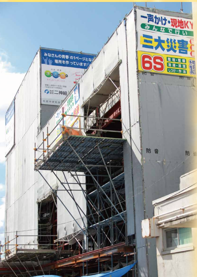
★松前中学校の南校舎改築工事着々と