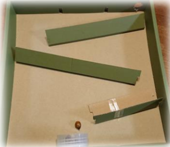
<どんぐりころがし>