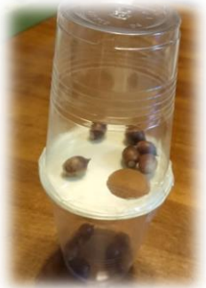
<どんぐり落とし & マラカス>