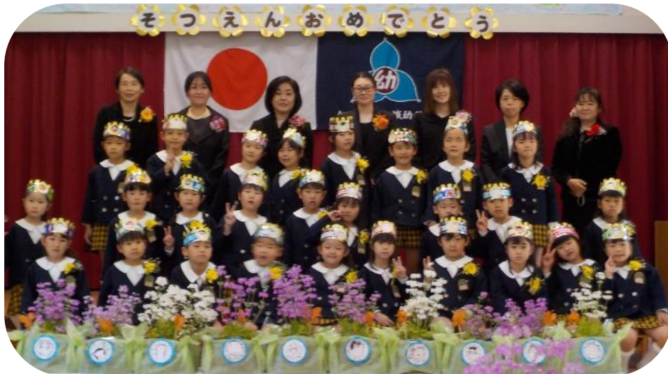
4歳児手作りの冠を被り、きりん組27名みんなで記念撮影をしました。