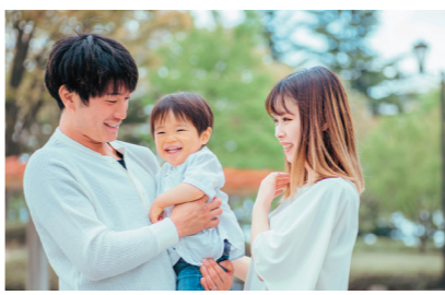
子育て・健康課児童福祉係

申請が必要な場合の詳細については、決まり次第町ホームページ(次のQRコード)でお知らせします。