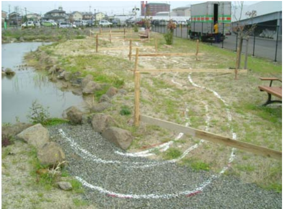
① 線形・水位レベルの確定