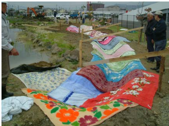
③緩衝材として毛布を敷く。