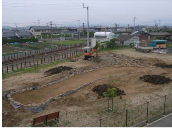
④真砂土を覆い石を組む