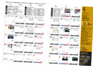
▲ 毎月のお役立ちカレンダーで実施日と連絡先を確認できます。