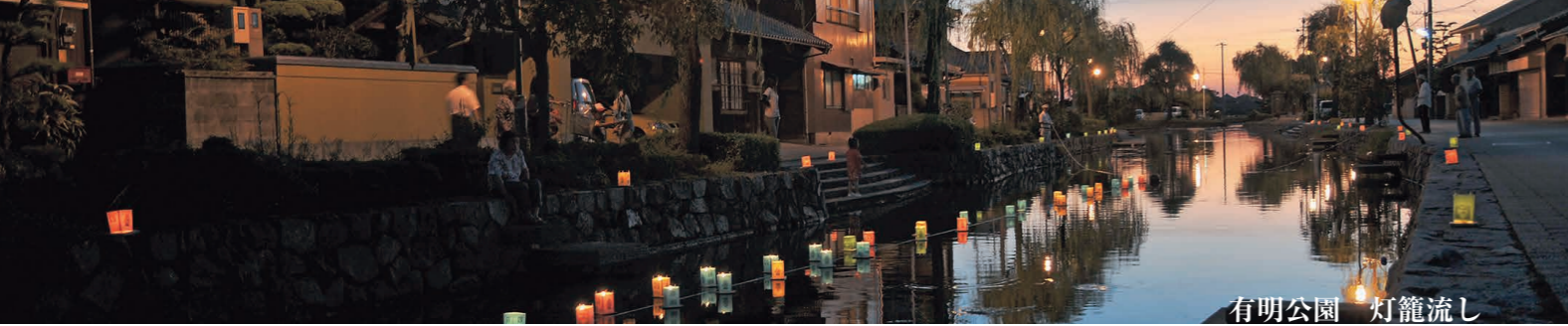
有明公園 灯籠流し