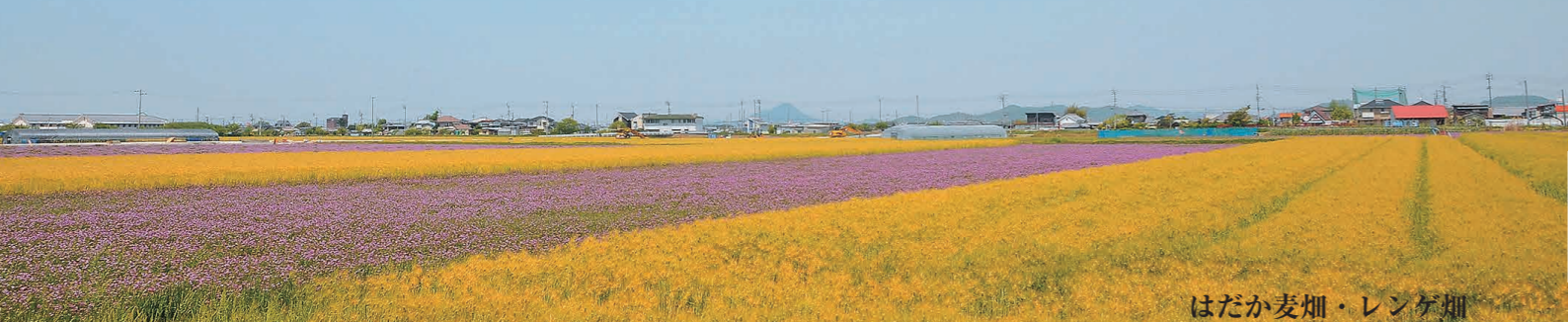
はだか麦畑・レンゲ畑