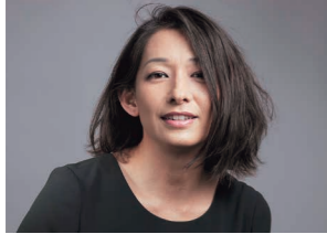
片岡 礼子 kataoka reiko

俳優。岡田小学校、岡田中学校、伊予高等学校を卒業し、大学進学で東京へ。力強い演技を売りに映画を中心に活動中。プライベートでは、3児の母でもある。主な出演作は、ドラマ「あなたの番です」、映画「空白」など。