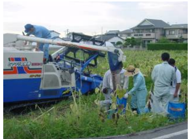
9月3日中川原地区刈り取り状況