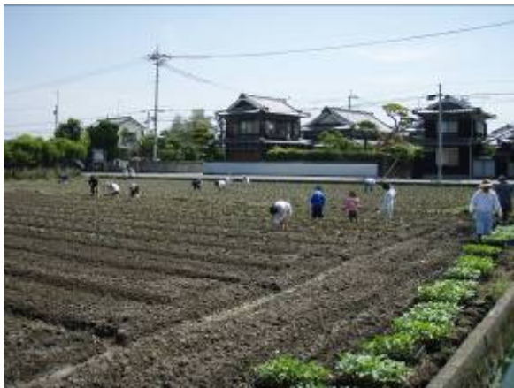
6 月 1 日東古泉地区播種状況