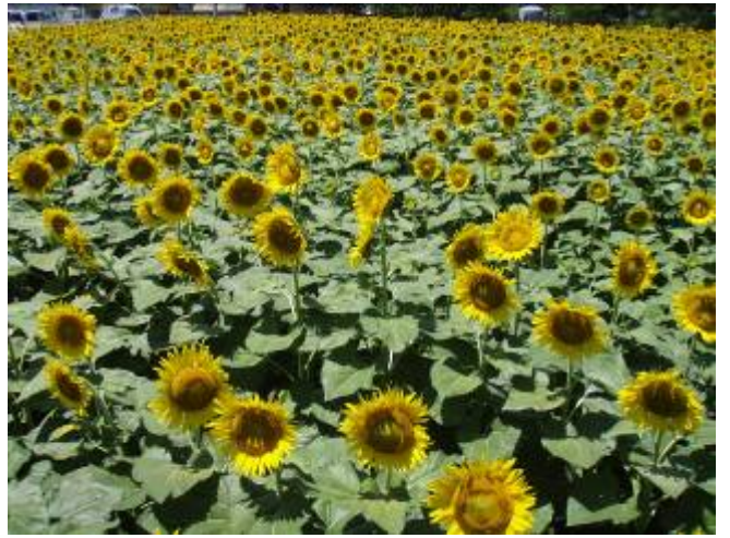
7月24日西古泉地区開花状況