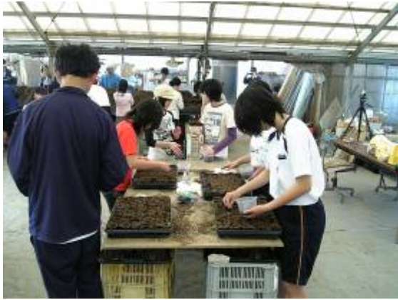
5 月 17 日西古泉地区播種状況