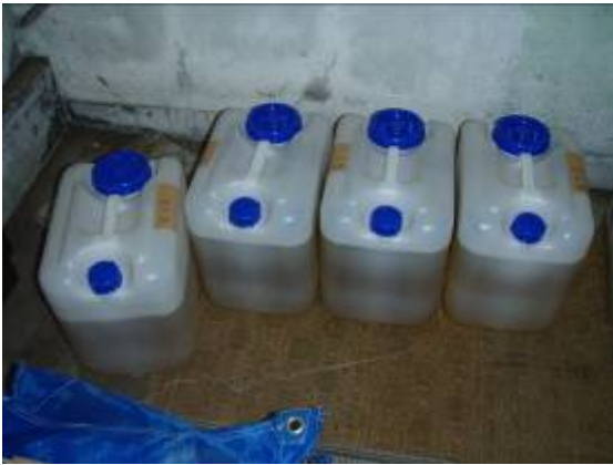
搾油作業後のひまわり油