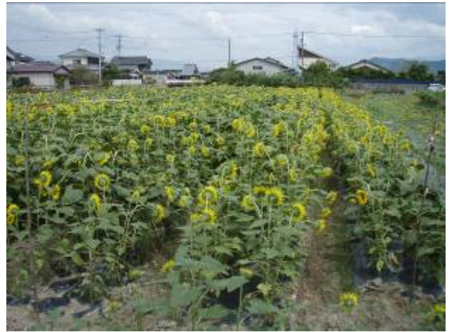
9月1日西古泉地区刈り取り状況