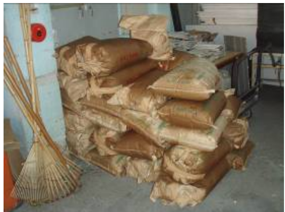
11月頃、黒田保育所、白鶴保育所、若葉保育所の給食でひまわり油を利用してもら