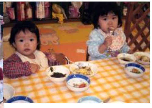
平成20年12月保育所給食献立表