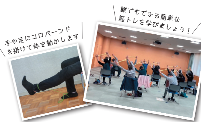
誰でもできる簡単な筋トレを学びましょう！ 手や足にコロボーンドを掛けて体を動かします