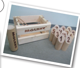
◀ 4月16日、上高柳地区で行われたモルックの様子

▼貸し出し数 5セット 屋内外問わずどこでも実施可能。スキットルを立てたり拾ったりする動作は軽い運動になります。投げる時は集中力を高め、点数計算は認知症予防にも効果的です。