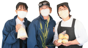
▲松前町生活研究協議会のメンバー