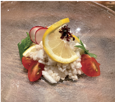
麦ト口的瀬戸内レモン合え

意見 「フェアをしたからよかった、知っていたらよかった」とはいかない。知って購入してもらったところまで、目標をもってやってほしい。