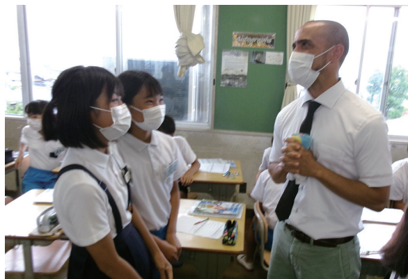
Let's Study English

問 英語の学力面での効果は。 答 各校区でALT同士による参観日をつくり、状況を見てもらった上で情報交換を行い、効果を上げる取組となった。