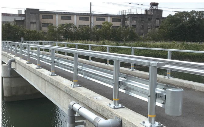
町道認定を受けた塩屋橋

答 通常、橋の管理者は河川改修時に県から町へ引き継がれるが、今回その記録がなく、管理者不明であった。県との協議の結果、橋の修繕を県が行った後、町が管理することとなった。今後、修繕する場合は、町が行う。