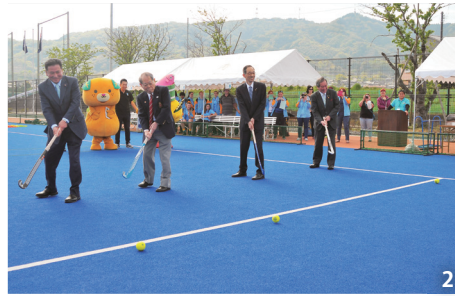
1_ 表敬訪問。再会を喜ぶ 2_ 始球式 3_ 鋭いドリブルで敵陣を切り裂く 4_ キーパーをかわずループシュート 5_ 相手を背負ってボールをキープ 6_ ブッシュレンジャーズの選手からぬいぐるみのプレゼント 7_ 歌で盛り上がるウェルカムパーティー 8_ 別れを惜しみバスを追い掛ける高校生