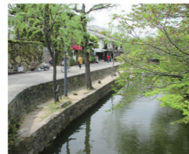
①モニター学習の様子 ②岡山市西消防署が所有する特殊災害対応車 ③倉敷美観地区の倉敷川