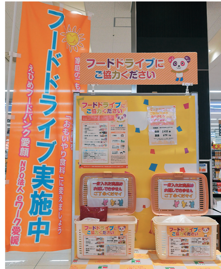
【愛媛県の食品ロス発生状況】