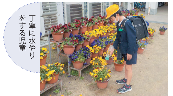
丁寧に水やりをする児童