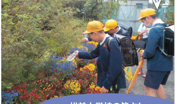
松前小学校の皆さん