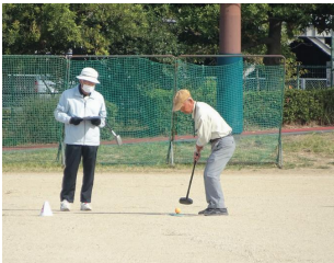
④暑い戦いが繰り広げられた軽スポーツ大会 ⑥館外研修で香川県普通寺へ ※共に昨年度の様子