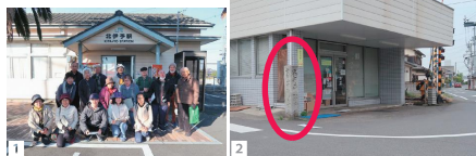
1 JR北伊予駅 今も昭和5年開業当時のままの姿である。往時は農産物や鉱山資源など荷物の輸送量も多く、日本通運の支店も開設されていた。今は無人駅になっている

駅南の踏切脇に「子聖道」案内石碑がある。「右松山道後道 左谷上山郡中道 西松前子聖道」とあるから、松山方面からや久万街道を下ってきて郡中や西古泉の子聖大権現へ向かう多くの人が、ここを利用していたのであろう。次号に続く。(麻生英毅記)【参考文献】愛媛県教育委員会編「えひめ、昭和の記憶 ふるさとのくらしと産業 12-松前町-」愛媛県教育委員会 2018