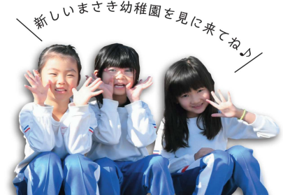
新しいまさき幼稚園を見に来てね♪

認定こども園の開園に先駆け、次の日時で内覧会を行います。増築されたとんがり屋根がトレードマークの午睡室、学校給食提供に向けて新設される給食受室や明るく開放的で床暖房を完備した保育室などをぜひ見に来てください。どんなでもご覧いただけます。 ▼日時 3月11日(火) 15時～16時 ▼住所 松前町大字北黒田9番地2 ☎ 985-4125