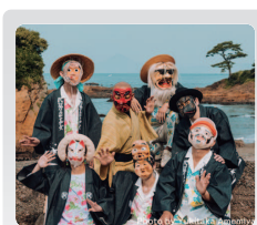
スペシャルゲスト 民謡クルセイダース small set