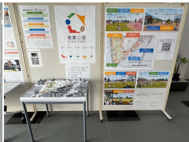
役場ロビーにて計画案・模型の展示