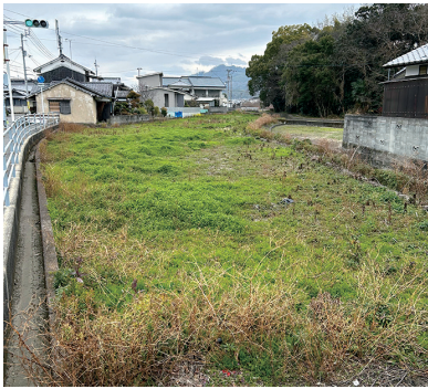
(第5分団消防詰所建設予定地)