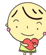
伊予市心の健康づくり イメージキャラクター 「こころちゃん」

家族懇談会では、ご家族の知りたい内容に合わせて学習会や座談会などを行っています。 日頃の思いを話してみませんか？みなさんのご参加をお待ちしています。