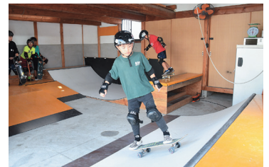
▲カッコいいスケーターを目指して