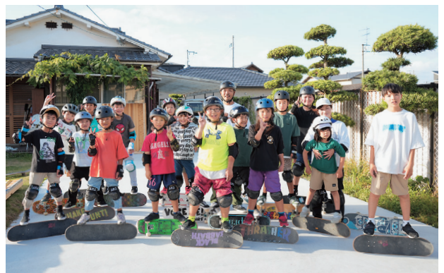
▲スケートボード仲間募集中！

経歴 競技歴27年。日本スポーツ協会公認スタートコーチ資格取得。第16回伊予小松ライオンズカップスケートボードコンテスト1位。