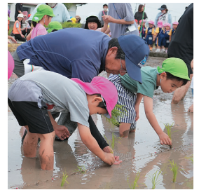
㊦ 一本一本丁寧に植えていく (北伊予小学校) ㊧ 徳丸農業区の皆さんに教わりながら(青葉幼稚園)